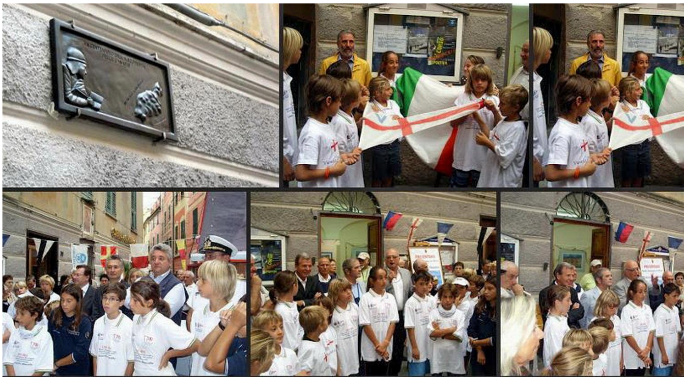
Lanzarottus Day del 2012 – La prima edizione

E, a questo punto, la commozione si fa sempre più sentita, fieri e orgogliosi di fare parte di questa comunità.