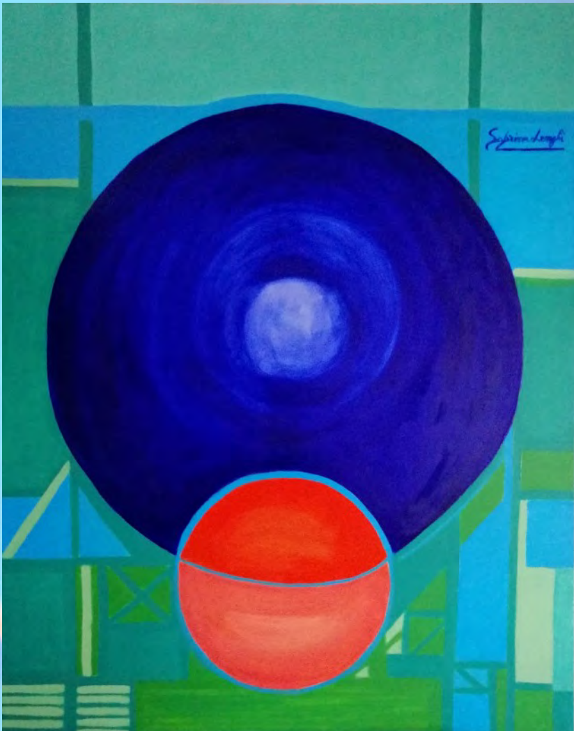
LA MATERNITA', olio su tela 80x100