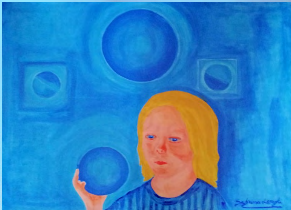
ARMONIA, olio su tela 60x80