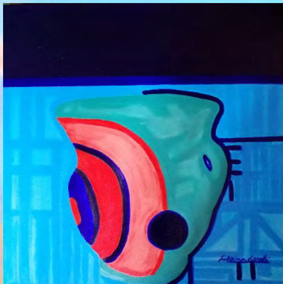
VASO SOTTO IL CIELO , olio su tela 60x60

Nell'arte di Sabrina Lenghi, il Cielo è solo Cielo cosmico e tutto sovrasta e protegge: ne è l'espressione l'olio su tela VASO SOTTO IL CIELO .