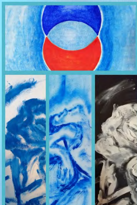
TRITTICO L'ABBANDONO, olio su cartoncino