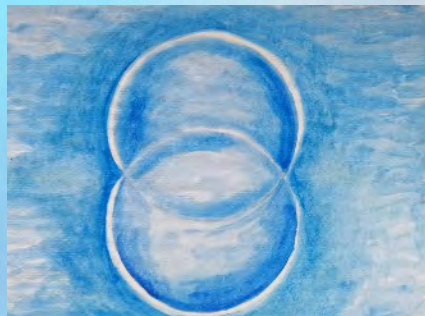
L'ABBRACCIO , olio su tela 60x60