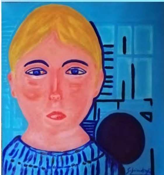
GEOMETRIA UNIVERSALE, olio su tela 60x60

Nel 1948 incontra il collega di vita e d'arte Pablo Picasso e con l'amico pittore, unitamente a Matisse, Modigliani ed altri, nell'anno 1954 espone alla Mostra di Disegno e dell'Incisione contemporanea a Chiavari (Genova). Sarà lo stesso Picasso a dire che tutto in lui è Opera d'arte, anche la sua firma. Da qui inizia per il Maestro una lunga carriera dal respiro nazionale ed internazionale senza fine, giunta sino ai giorni nostri.