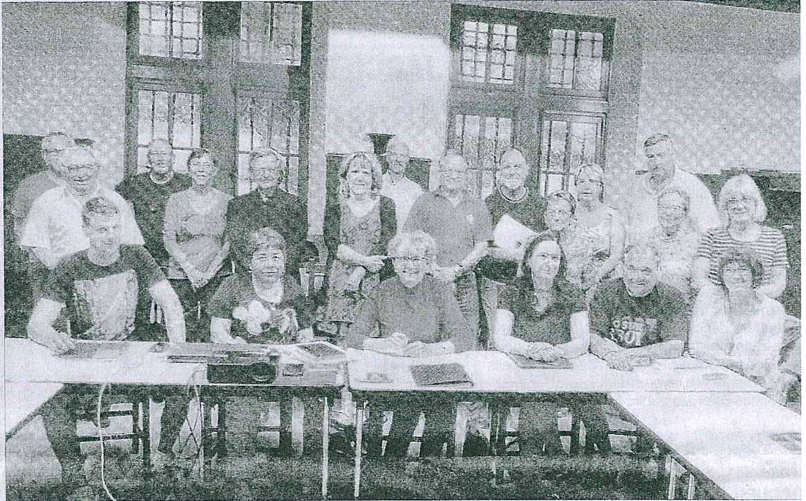
Au côté de la municipalité, l'association Roussillon Jumelage a beaucoup œuvré pour finaliser le projet de jumelage entre Roussillon

Pour Michèle Heysck-Biasol, « ce jumelage aidera les Roussillonnais à mieux connaître leurs plus proches voisins. Des liens amicaux se tisseront entre les participants