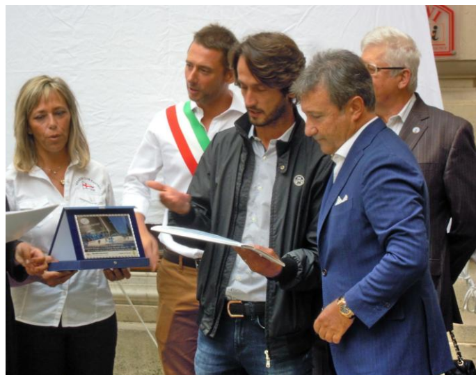
Premiazione del Testimonial Lupi