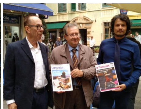
Coll - Licata - Cabrera