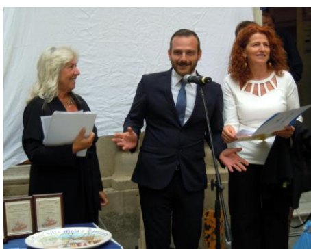
Agenzia Grecale Viaggi