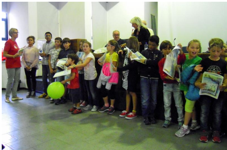
Bambini del doposcuola Oratorio Don Bosco

- Dei vincitori di " Culturpesca ", il raduno di pesca e cultura dedicato a Lanzarotto Malocello , organizzato dall'Associazione Pesca Sportiva Varazze, con 10 domande sulla vita e impresa compiuta dal navigatore varazzino. Alle prime tre coppie classificate sono stati consegnati gli attestati di partecipazione e i due buoni sconto da 50€, messi in palio da " Nautica Ferramenta " di San Nazario, consegnati dalla mamma di Margherita Bottoni , titolare del noto esercizio commerciale, e sorteggiati tra tutti i partecipanti.