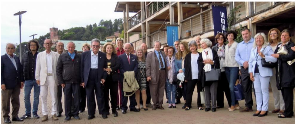
Foto di gruppo a Marina di Varazze