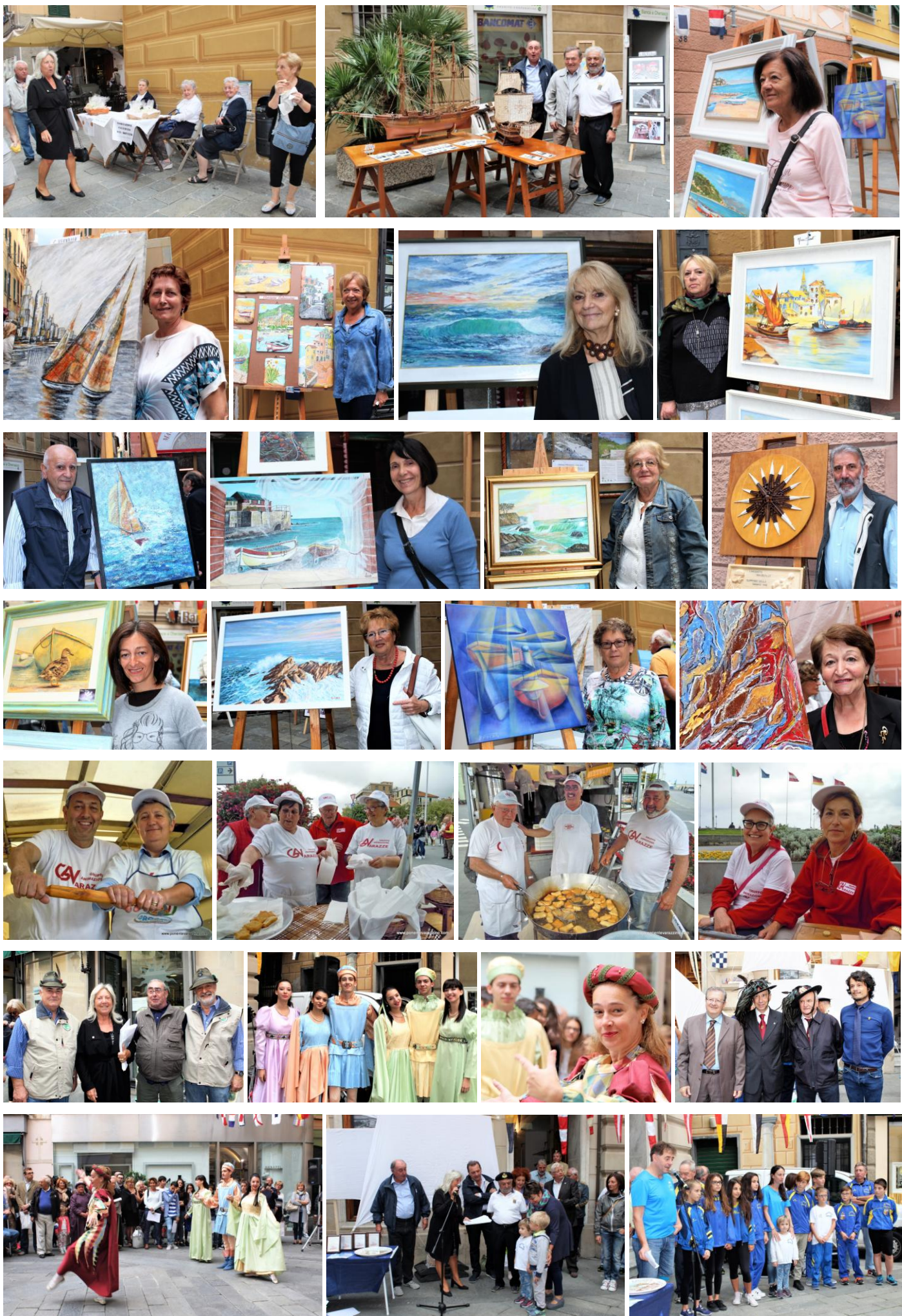
Alcuni scatti del fotografo Giuseppe Di Terlizzi