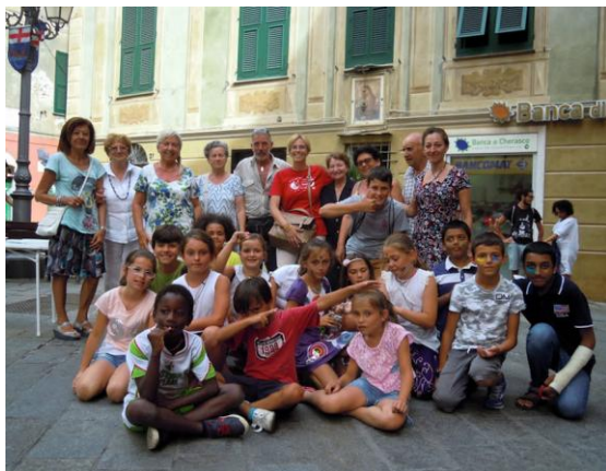
Doposcuola Oratorio Don Bosco

«La celebrazione del navigatore ed esploratore varazzino, Lanzarotto Malocello, che ha dato l'avvio alla storia moderna delle Isole Canarie, è consacrazione non solo di una storica impresa, ma anche della tradizione marinara della nostra Liguria, del suo stretto legame con il mare e del desiderio di scoperta dei suoi illustri navigatori. A nome dell'Amministrazione comunale porgo vivissimi auguri di buon lavoro alla Città di Varazze, a tutti i partecipanti al "Lanzarottus Day 2017" e alle delegazioni del Lions Club di Roma, del Cabildo di Lanzarote e del Real Club Nautico di Arrecife.»