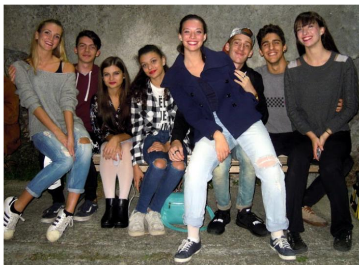
I ballerini di Palcoscenicodanza ASD Danzastudio

La serata si è poi conclusa presso l'Oratorio di Nostra Signora Assunta, con un rinfresco che l'Assessorato alla Cultura ha offerto ai figuranti, ballerini e agli ospiti di Lanzarote, Roma e altre regioni italiane, che hanno gradito e ringraziato in dialetto varazzino e ligure, in italiano e in spagnolo.