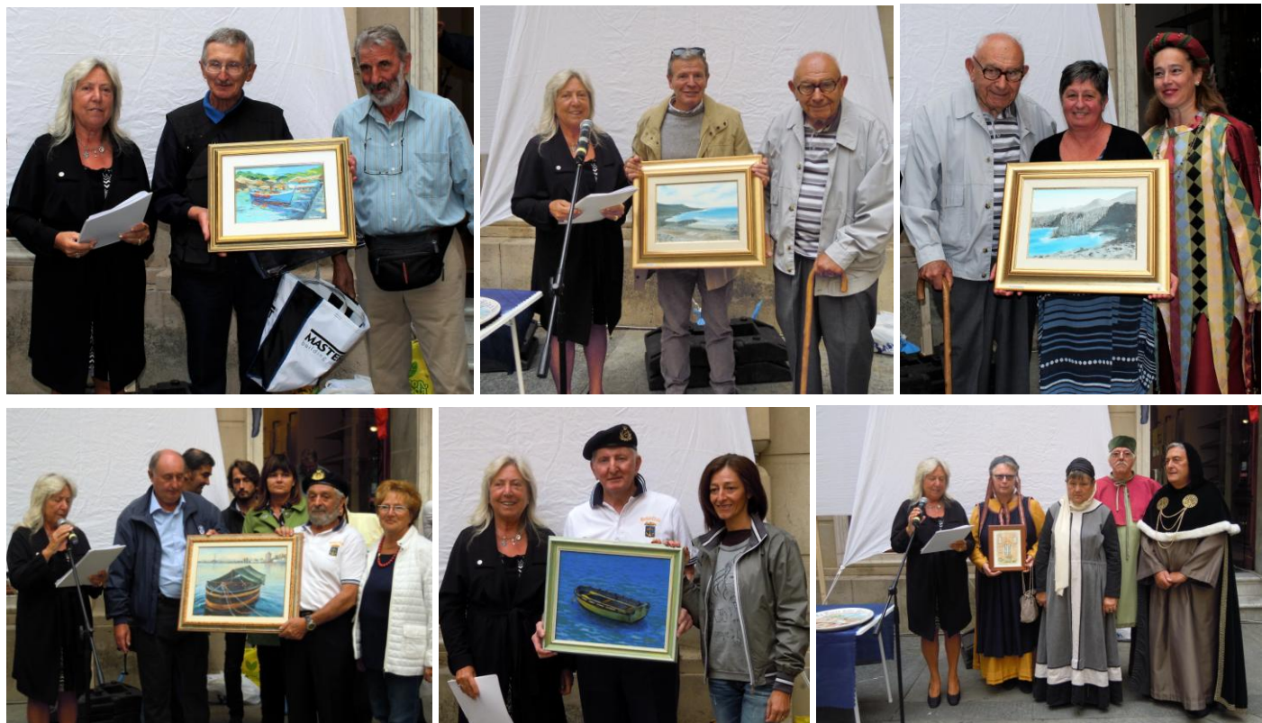
Alcune delle premiazioni del locale associazionismo, fatto con i quadri donati dagli Artisti che sostengono il progetto

La cerimonia è poi proseguita con la citazione e premiazione delle associazioni e persone, che si sono maggiormente adoperare nell'organizzazione delle tante manifestazioni di vario genere (ricreativo, culturale, socio-aggregativo e sportivo), che in cinque mesi hanno contribuito a mantenere viva l'attenzione su questo importante evento.