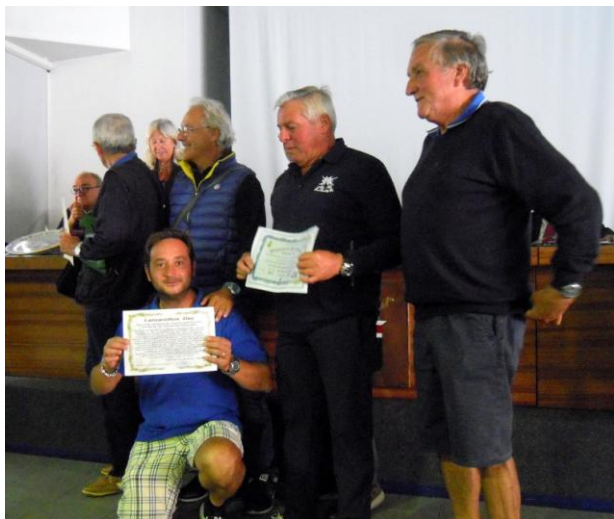
I vincitori di Culturpesca