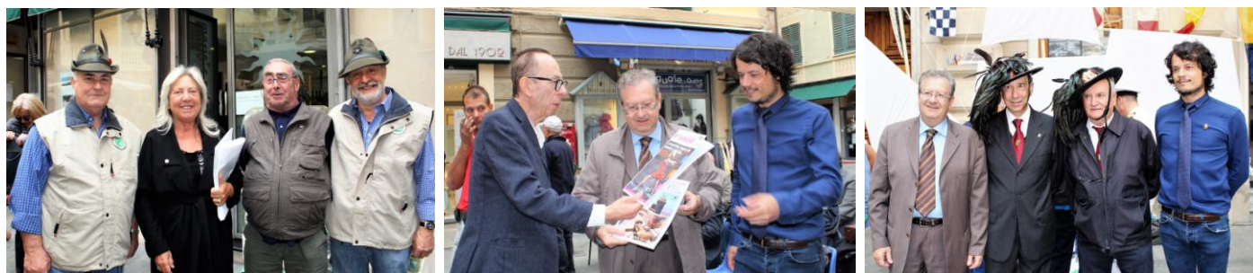
Alcuni primi piani del fotografo Giuseppe Di Terlizzi, socio del Foto Cine Club Varazze, che ringraziamo

La settima edizione del " Lanzarottus Day " è stata inserita nel Calendario Eventi, Manifestazioni e Visite guidate del Geoparco del Beigua.