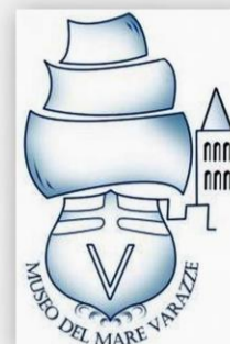
Museo del Mare Varazze