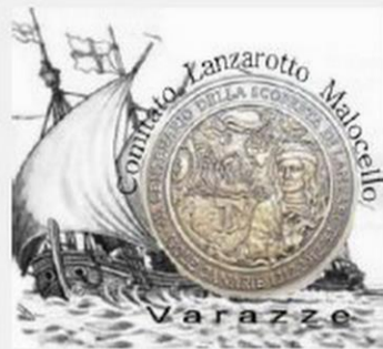
Comitato Lanzaotto Malocello Varazze