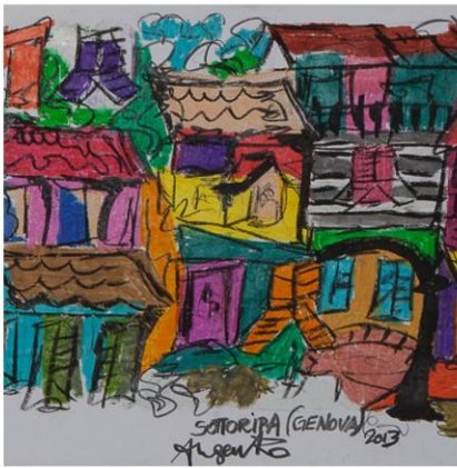
Sottoripa, pastello + carboncino su cartone, 2014