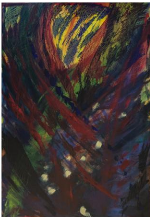
Struttura del Cuore, Acrilico su tela, 2104

Hilke Kracke info@hilkekracke.it www-hilkekracke.it