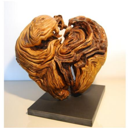
HearthH, legno di castagno, 2010