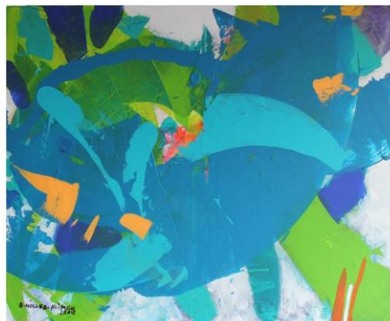
For M 4, acrilico su tela, 2014

www.kunst-arte.org info@kunst-arte.org www.focuseuropa.de